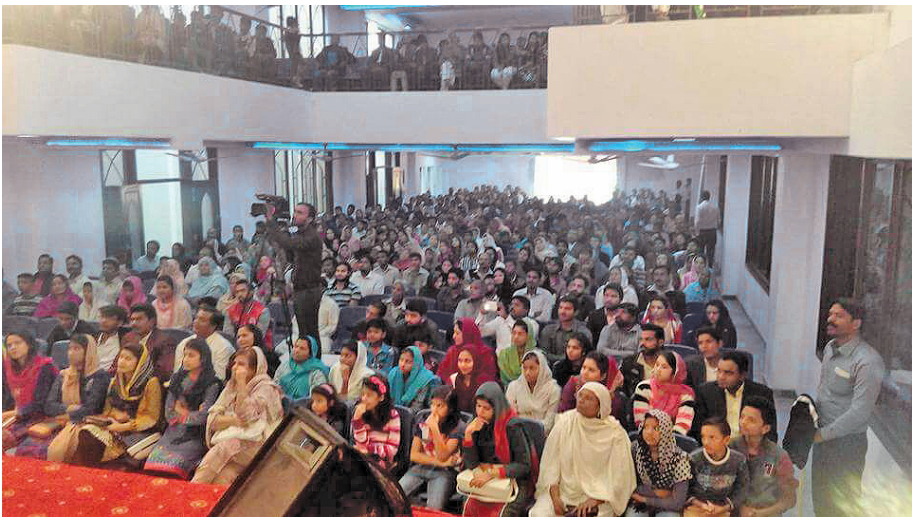
Tento snímek ukazuje druhé shromáždění v jednom kostele v Láhauru, Pákistán.