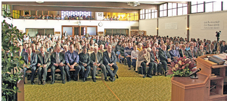
Shromáždění 4.prosince v misijním centru Krefeld

Svobodná lidová misie informační kancelář Doubecká 556 Jahodnice Praha 9 - Kyje CZ-198 00 tel. 281 931 729 e-mail: info@svobodnalidovamisie.cz